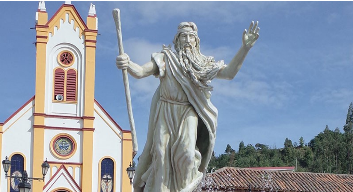
Bochica - Plaza de Cuítiva

Un buen día en medio de la rutina Chibcha comenzó a caer agua del cielo, al principio era una lluvia tenue que con el paso de las horas se convirtió en una torrencial lluvia que no se detuvo en cuatro noches, entonces los principales líderes se reunieron ante la emergencia y calamidad que el agua ocasionó: los cultivos fueron arrasados y las viviendas estaban bastante deterioradas.