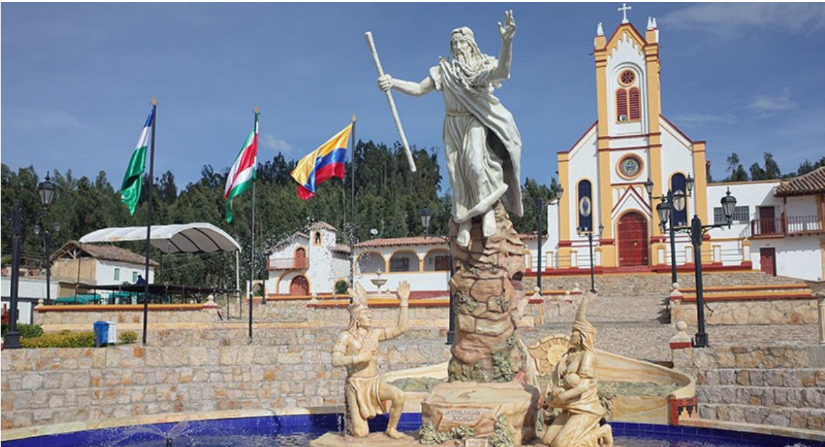
Bochica - Plaza de Cuítiva